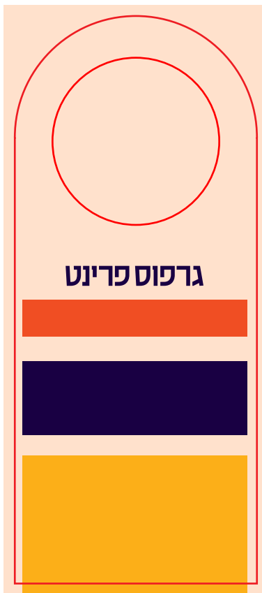
עמוד שני הדמיה לחיתוך