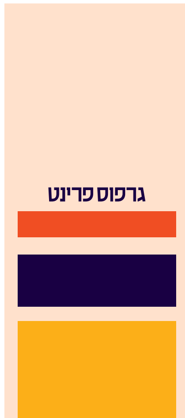
עמוד אחד גרפיקה עם גלישה