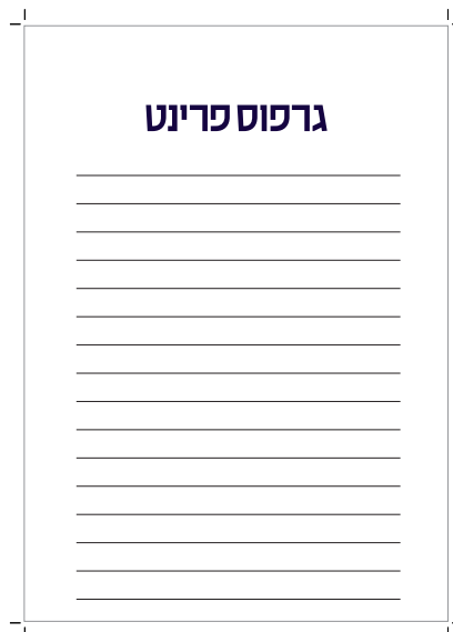
אין צורך בגלישה