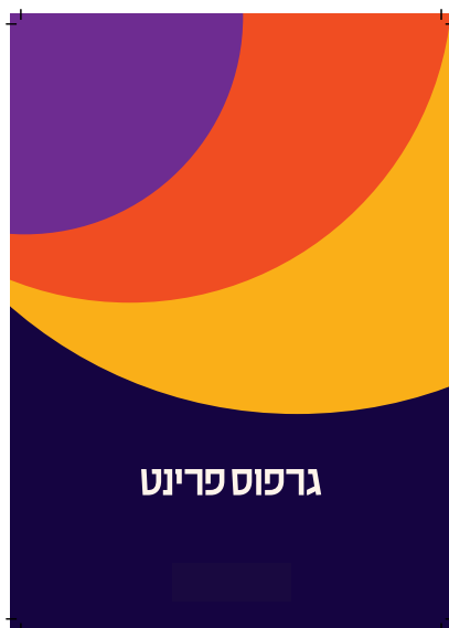
יש צורך בגלישה