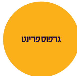
עמוד שני הדמיה לחצי חיתוך