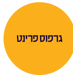
עמוד שני הדמיה לחצי חיתוך