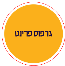
עמוד שני הדמיה לחיתוך