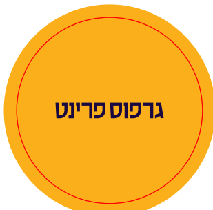
עמוד שני הדמיה לחיתוך