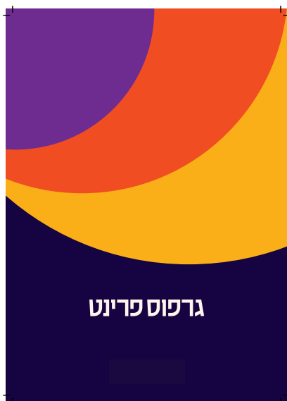
יש צורך בגלישה