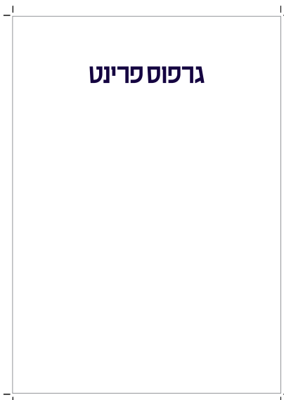
אין צורך בגלישה